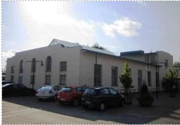
Kustaa Tiitun tie 1