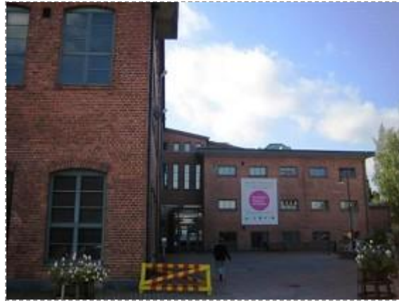
Kustaa Tiitun tie 1