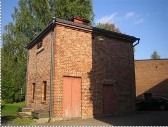
Kustaa Tiitun tie 1