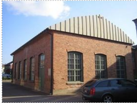
Kustaa Tiitun tie 1