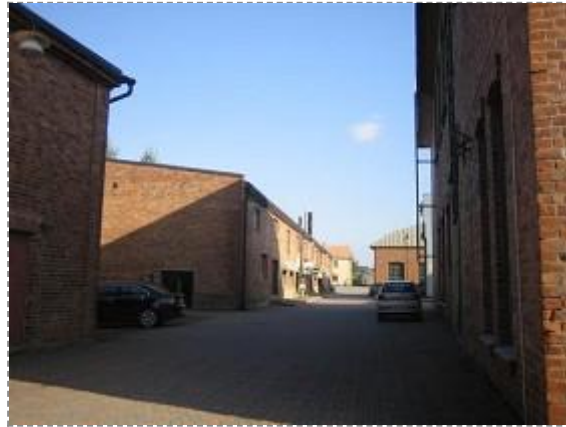
Kustaa Tiitun tie 1