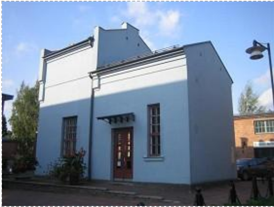
Kustaa Tiitun tie 1 (Kuva: Anne Ojanperä 02.09.09)