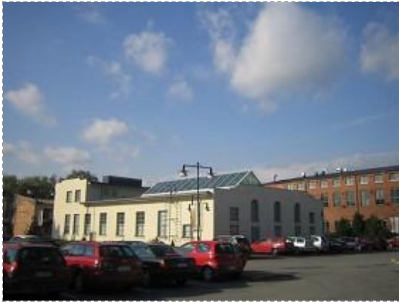
Kustaa Tiitun tie 1