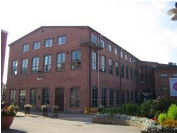
Kustaa Tiitun tie 1 (02.09.09)