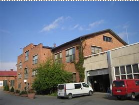
Kustaa Tiitun tie 1