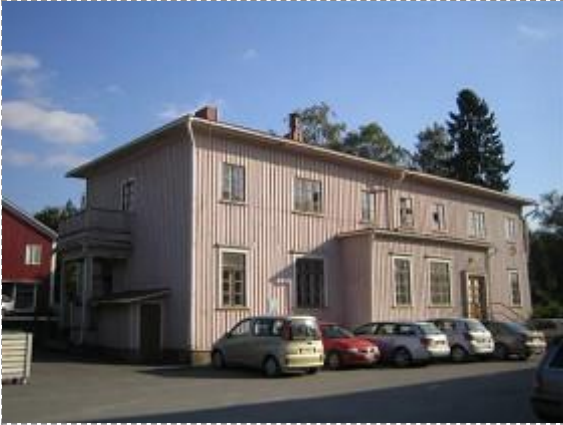
Kustaa Tiitun tie 1 (Kuva: Anne Ojanperä 02.09.09)