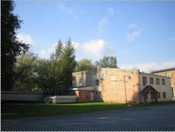
Kustaa Tiitun tie 1 (Kuva: Anne Ojanperä 02.09.09)