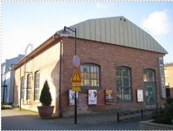
Kustaa Tiitun tie 1 (02.09.09)