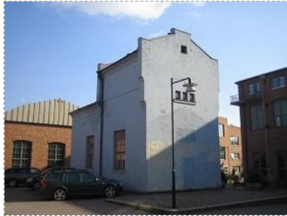
Kustaa Tiitun tie 1 (Kuva: Anne Ojanperä 02.09.09)