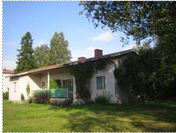
Kustaa Tiitun tie 1