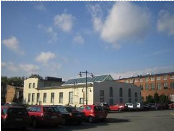
Lataamo eli taidemuseo